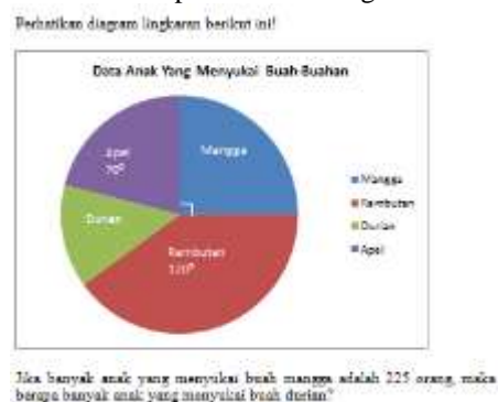
Gambar 1. Soal indikator mengajukan dugaan

Pada Indikator 1 peserta didik diharapkan mampu memberikan dugaan atau perkiraan dalam menentukan besar bagian diagram lingkaran. Dalam pelaksanaan model discovery learning peserta didik dapat mengajukan dugaan dengan cara diberi rangsangan ( stimulation ) melalui masalah ( problem statement ) yang diberikan. Akibatnya, dapat menimbulkan rasa keingintahuan peserta didik terhadap apa yang akan dipelajari sehingga peserta didik akan memberikan beberapa dugaannya terkait masalah tersebut. Soal untuk indikator ini dapat dilihat sebagai berikut: