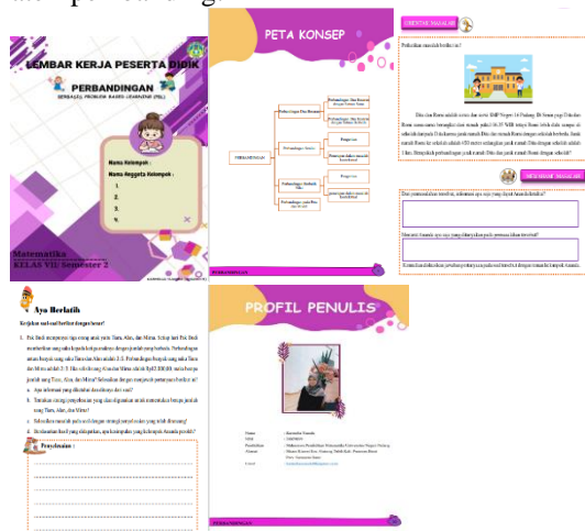
Gambar 4. Hasil Rancangan LKPD

Berdasarkan hasil analisis awal, prototipe pertama LKPD disusun. Gambar 4 menampilkan hasil rancangan LKPD yang dibuat dengan menggunakan materi pembandingan.