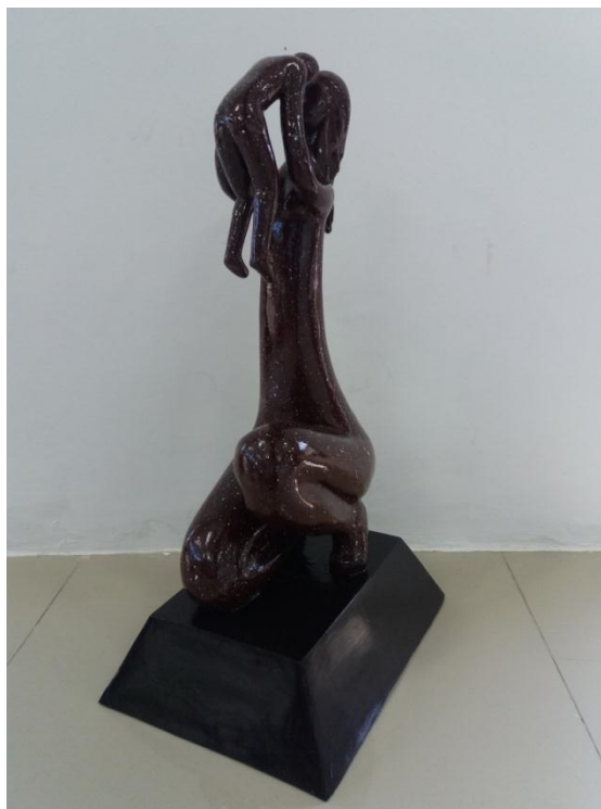
Gambar 20 Judul "Ungkapan Cinta Ibu" Ukuran 60 cm Teknik casting 2017

Karya kelima ini, karya patung yang berjudul "Ungkapan Cinta Ibu" memvisualkan seorang ibu berambut panjang yang sedang mengangkat anaknya sambil mendekatkan kepala anak ke kepala si ibu. Kedua tangan antara ibu dan anak terlihat menyatu. Posisi ibu yang sedang