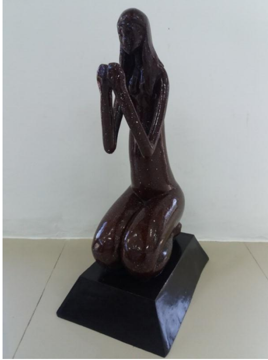
Gambar 22 Judul "Ketulusan" Ukuran 60 cm Teknik casting 2017

Karya ke tujuh ini, karya patung yang berjudul "Ketulusan" memvisualkan seorang ibu yang berambut panjang terurai sedang duduk bersimpuh. Kedua telapak tangan terangkat ke atas hingga tepat di depan dada.