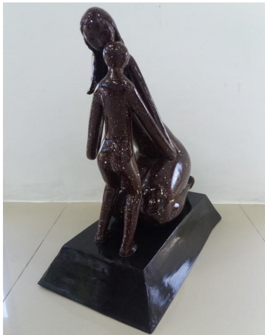
Gambar 21 Judul "Mendidik" Ukuran 60 cm Teknik casting 2017