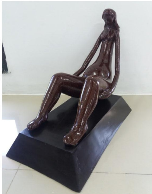
Gambar 18 Judul "pengorbanan" Ukuran 45 cm Teknik casting 2017