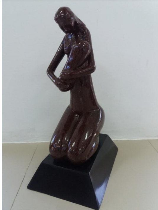
Gambar 19 Judul “Kasih syang” Ukuran 60 cm Teknik casting 2017

Karya keempat ini, karya patung yang berjudul “Kasih Sayang” merupakan bentuk dari visualisasi seorang ibu yang sedang duduk bersimpuh sambil menggendong bayinya. Ibu yang berambut panjang sambil menundukan kepalanya menghadap wajah anaknya. Pada karya ini terlihat ibu yang sedang menyusui anaknya dengan gerakan kedua tangan si ibu memeluk bayi dan menempelkan wajah bayi ke payudaranya.