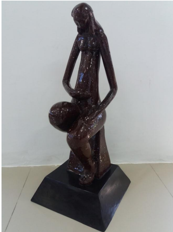
Gambar 16 Judul "permulaan" Ukuran 60 cm Teknik casting 2017

Karya pertama ini berjudul "Permulaan" memvisualkan seorang ibu yang sedang duduk di atas batu dengan mengangkat dan melipat satu kaki. Sosok ibu berambut panjang dengan gerakan tangan yang mengelus perutnya yang sedikit membesar dengan kondisi kepala menunduk.