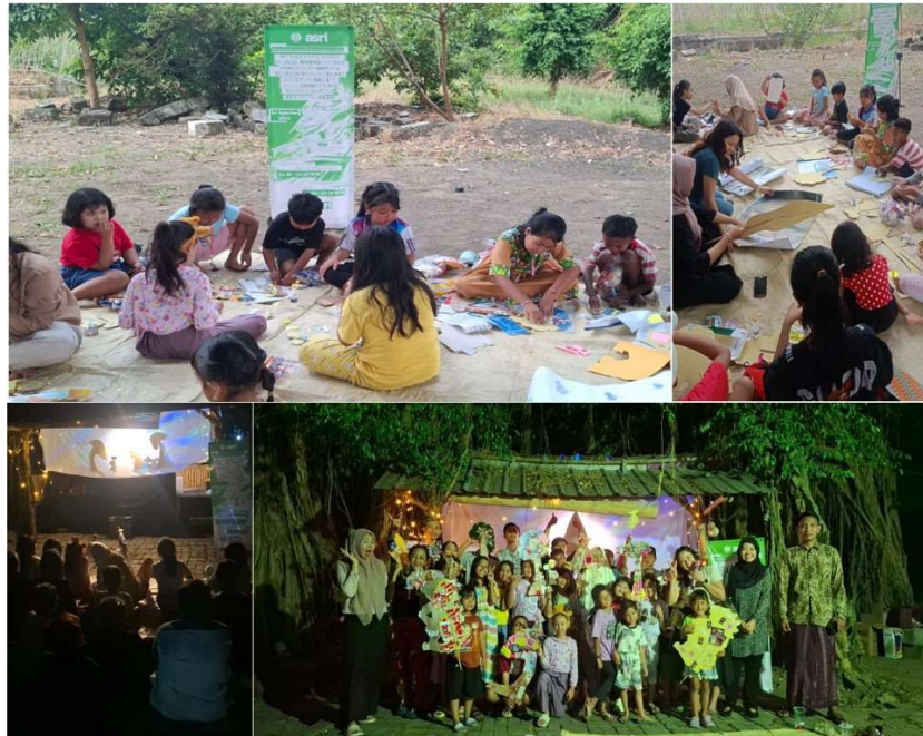
Gambar 1. Dokumentasi Workshop dan Pentas Wayang Limbah

Selanjutnya dilakukan kegiatan workshop membuat wayang limbah difokuskan pada proses kreatif anak dalam merancang tokoh dari bahan daur ulang. Peserta diberikan referensi karakter dan lakon wayang tradisional, seperti Arjuna (keberanian dan kebijaksanaan), Bima (kekuatan dan keberanian), Semar (kebijaksanaan dan tanggung jawab), dan Srikandi (keberanian dan keteguhan hati), sebagai dasar pemahaman simbol tokoh sebelum membuat wayang. Kemudian diberikan bimbingan teknis secara bertahap oleh fasilitator dari Komunitas ASRI, mulai dari pemilihan dan pengolahan bahan limbah, pemotongan, penempelan, hingga pewarnaan dan penyusunan karakter, dengan pendekatan yang interaktif dan partisipatif. Pendekatan ini tidak hanya melatih keterampilan motorik halus dan koordinasi visual-motorik anak, tetapi juga menanamkan nilai budaya, kreativitas, dan kesadaran ekologis melalui praktik langsung, sehingga anak-anak memperoleh pengalaman belajar yang kontekstual, menyenangkan, dan edukatif.