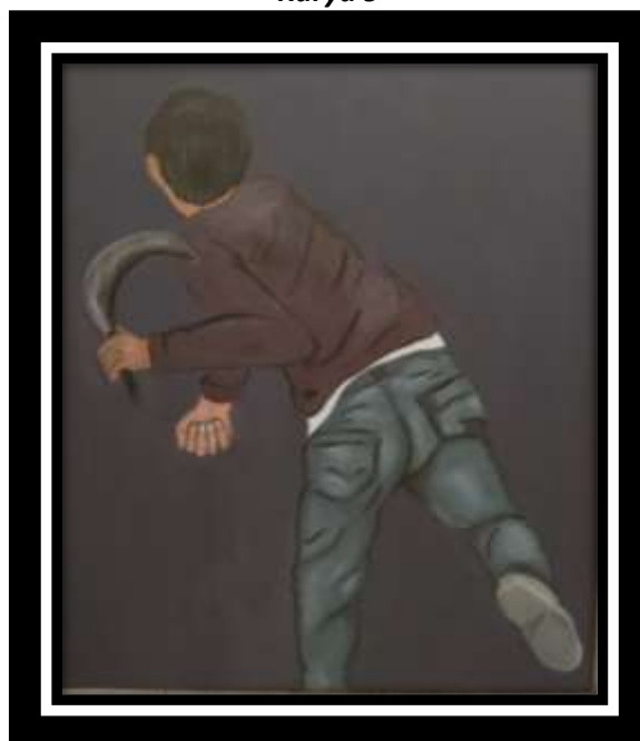
“Tauran” 2023 100 x 120 cm Akrilik di atas Kanvas

Lukisan yang berjudul Karya yang berjudul “ tauran” menggambarkan seorang remaja laki laki sebagai figur utama yang mana memperlihatkan bahwa remaja ini menghadap belakang, dengan menggunakan switer lengan panjang, berwarna ungu gelap serta celana berwarna abu abu dan juga memperlihatkan adanya sedikit baju berwarna sedikit dalaman switer serta sabit atau celurit yang di pegang sebelah kiri.