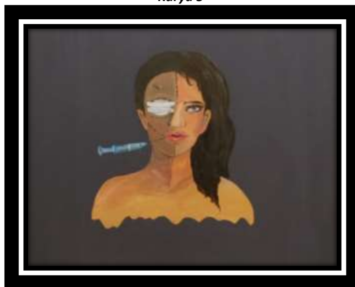
“Demi” 2023 100 x 100 cm Akrilik di atas Kanvas

Lukisan yang berjudul “demi keinginan” menggambar objek potret seseorang remaja perempuan dengan memperlihatkan wajahnya dengan memperlihatkan bentuk waja dengan 2 sisi yang berbeda dimana wajah bagian kiri berwarna gelap dan juga ada perban di bagian mata, sedangkan dibagian kanan remaja ini memperlihatkan wajah dengan warna kulit pada umumnya pada bagian rambut juga berbeda tiap sisi yang kiri dengan rambut kriting pendek sedangkan bagian kanan dengan rambut hitam lurus.