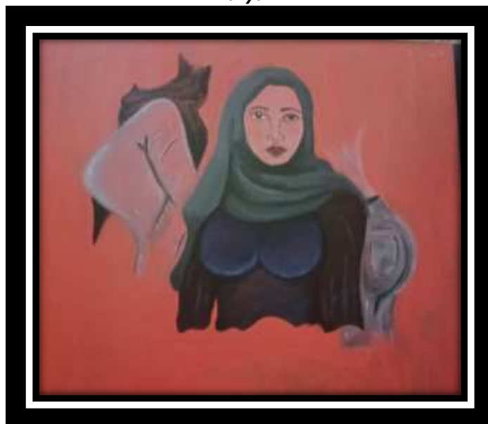
“Tak Sesuai Ukuran” 2023 Karya Panel 100 x 100 cm Akrilik di atas Kanvas

Lukisan yang berjudul “tak sesuai ukuran” memperlihatkan remaja perempuan yang menggunakan kerudung berwarna abu abu serta baju kaos panjang berwarna merah maron.