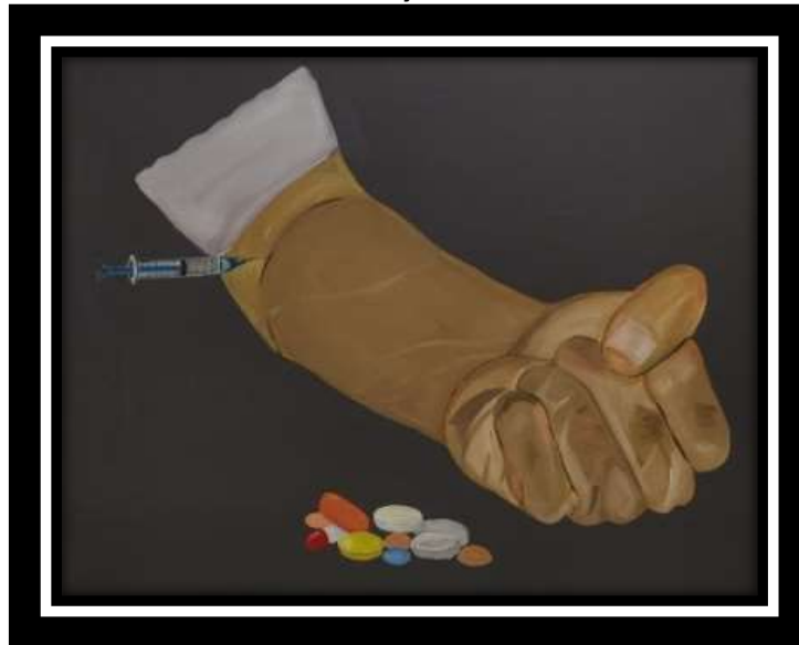
“Benteng Terdepan” 2023 100 x 120 cm Akrilik di atas Kanvas

Lukisan dengan judul “Narkoba” memperlihatkan objek yang di diyakini seorang remaja laki laki pada lukisan ini memperlihatkan tangan laki laki yang terkepal kuat dengan menggunakan baju berwarna putih pada bagia lengan, gambar ini juga memperlihatkan gambar jarum suntikan dekat tangan laki laki tersebut dan juga adanya obat obatan dan sabu sabu pada bagian bawah.