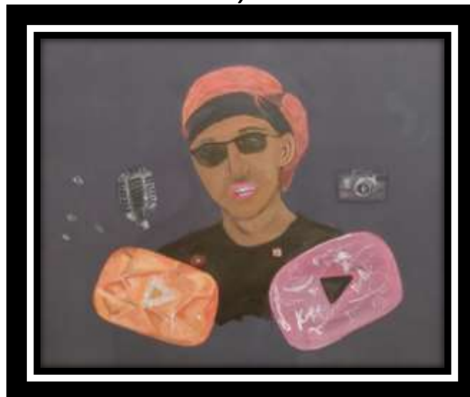
“Youtuber” 2023 100 x 100 cm Akrilik di atas Kanvas

Karya dengan judul “Youteber” ini terlihat seorang remaja laki-laki yang memegang dua tropy diamond dengan logo youtube, remaja laki-laki itu juga memperlihatkan warna rambut yang mencolok dengan warna keemasan dan juga ada