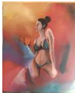
Mewah Acrylic on canvas (100 cm x 120 cm), 2020

Objek dari lukisan penulis memvisualkan lelaki yang tanpa baju dan memakai topi warna hitam yang menutupi matanya degan posisi menyamping. menggambarkan dia berjalan dan melakukan hal yang dia suka tanpa melihat apa yang dia lakukan enar atau salah untuk mendapatkan kesenangan berikutnya walau ada yang harus dia lakukan untuk bisa mendapatkan yang dia harapkan lebih dari saat ini. Penulis memerikan warna yang cerah di objeknya dan warna-warna gelap di bgianblakang dan bawah objek dan gian lebih cerah di bgian depan objek