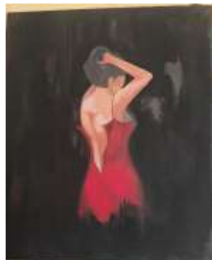
Pilihan 2 Acrylic on canvas (100 cm x 120 cm), 2020

Penulis memvisualkan lelaki yang tanpa busana yang membelakangi dengan posisi tangan lagi memengagi kepala dan menghadap kearah bawah Penulis memerikan wara terang pada obbjek dan warna terang dan gelap pada latarnya menggambarkan Jalan yang dia pilih untuk memenuhi kebutuhan hedonis dengan cara yang dipilihnya sendiri, jadi dia merasa aneh dan penyesalan walau ada kesenangan dari dalam dirinya sendiri atas pilihannya.