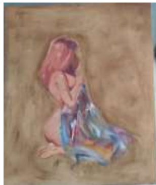
Cara Acrylic on canvas (100 cm x 120 cm), 2020

Penulis memvisualkan wanita yang lagi berdiri mengenakan baju berwarna merah dan salahsatu tangannya di angkat tinggi dan tangan satunya mengangkat sebagian bajunya yang membuat sebelah pahanya terlihat dan penulis memvisualkan seekor kupu-kupu yang lagi hinggap di kepala wanita. Penulis memberikan warna yang cerah dlam lukisan ini denagn sedikit bagian gelap di latarbgian bawah latarnya. Memerikan pendapat yang dia lakukan dengan kepuasan diri sendiri yang membuatnya merasakan hal mewah dan menyenangkan baginya walau itu ukan carayang baik