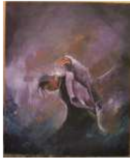
Disko Acrylic on canvas (100 cm x 120 cm), 2020

dengan penuh manik putih. memerikan warna yang terang untuk objeknya untuk menunjukkan keberadaannya dengan pakaian yang mewah dan dengan suasana acarah yang mewah yang membuat dirinya merasa bahwa dialah yang utama dalam pesta tersebut. Penulis memberikan warna-warna yang terang sebagai symbol senang di ojeknya dan memberikan warna kemerahan yang menunjukkan kemarahan dan untuk latarnya dengan aksen aura yang lebih gelap di sekeliling objek menunjukkan suasana dari dalam dirinya.