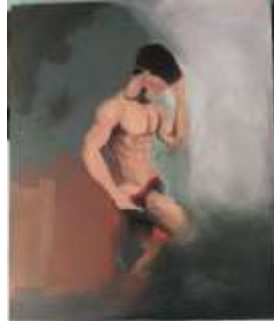
Senang 2 Acrylic on canvas (100 cm x 120 cm), 2020

cerah diobjek dan di bunga menggambarkan kesenangan dan keangunan, untuk latar penulis membbberikan warna gelap.