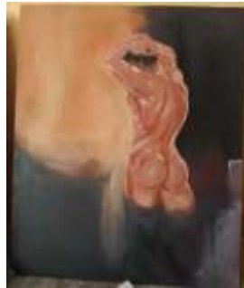
Pilihan Acrylic on canvas (100 cm x 120 cm), 2020

Penulis memvisualkan lelaki yang tanpa busana yang membelakangi dengan posisi tangan lagi memengagi kepala dan menghadap kearah bawah Penulis memerikan wara terang pada obbjek dan warna terang dan gelap pada latarnya menggambarkan Jalan yang dia pilih untuk memenuhi kebutuhan hedonis dengan cara yang dipilihnya sendiri, jadi dia merasa aneh dan penyesalan walau ada kesenangan dari dalam dirinya sendiri atas pilihannya.