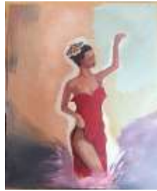
Mendapatkan Acrylic on canvas (100 cm x 120 cm), 2020

Penulis memvisualkan wanita yang lagi berdiri mengenakan baju berwarna merah dan salahsatu tangannya di angkat tinggi dan tangan satunya mengangkat sebagian bajunya yang membuat sebelah pahanya terlihat dan penulis memvisualkan seekor kupu-kupu yang lagi hinggap di kepala wanita. Penulis memberikan warna yang cerah dlam lukisan ini denagn sedikit bagian gelap di latarbgian bawah latarnya. Memerikan pendapat yang dia lakukan dengan kepuasan diri sendiri yang membuatnya merasakan hal mewah dan menyenangkan baginya walau itu ukan carayang baik