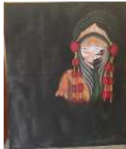
Raja Acrylic on canvas (100 cm x 120 cm), 2020

Dalam visual karya ini menggambarkan sosok seseorang yang memakai topeng yang tersenyum dengan mata yang menatap plong dan tajam juga menggunakan hiasan kepala berwarna emas. Menunjukkan keberadaan yang bergelombang harta jadi merasa dia bisa melakukan apa saja yang disukainya dengan pakaian mewah dan sikap yang memandang rendah orang lain. Pada objek karya penulis memberikan warna-warna yang terang yang menunjukkan kesenangan dan untuk bagian latarnya penulis memberikan warna gelap menunjukkan hal yang tidak baik dibalik.