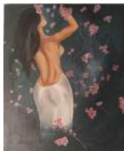
Senang Acrylic on canvas (100 cm x 120 cm), 2020

Penulis memvisual objek lelaki yang sedang menari denagn menggunakan jaket warna ungu dan dlamam warna gelap dengan posisi lagi bergoyang menunduk denagn lengan yang lagi di angkat lebih tinggi Membuat diri dalam kesenangan yang dia butuhkan dari suatu music yang disenangi nya yang bertajuk mewah dalam desco yang dinikmatinya. Penulis memberikan warna untuk objek tidak terlalu terang dan background yang yang sedikit trang di bagian objek dan selebihnya gelap