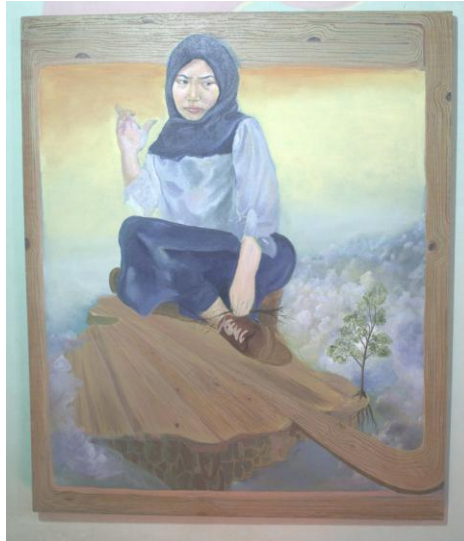
Karya: Gendi Malinyo Judul : Berlidung dibalik Prodak Ukuran: 100 X 150 cm Media : Acrylic On Canvas Tahun: 2019

Karya ke dua ini memberikan pandangan keindahan atau keunikan yang terlihat, sebenarnya hanya sebagai bentuk pembelaan atau menutupi sesuatu (baik atau buruk) agar tidak tampak, oleh seseorang atau sekelompok orang. Hal tersebut bisa dikatakan sebagai manipulasi. Manipulasi merupakan salah satu perilaku yang tidak jujur. Perilaku seperti ini banyak ditemui dalam kehidupan sehari-hari. Mulai dari hal kecil yang biasa dilakukan sampai pada suatu hal yang besar.