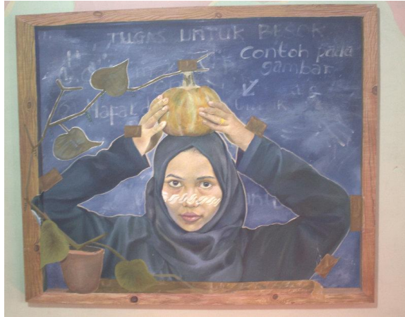
Karya: Gendi Malinyo Judul: Tumbuh Tidak Pada Tempatnya Ukuran: 120 X 100 cm Media: Acrylic on canvas Tahun: 2019

Pada karya ini, Seseorang yang telah mendapatkan sesuatu berupa ilmu, prestasi atau penghargaan manusia seringkali mengabaikan proses yang terjadi yang menyebabkan hilangnya rasa peduli terhadap proses yang telah dilalui. Hal ini mencerminkan bahwa dalam menjalankan kehidupan bukan mencari alasan atas apa yang telah didapatkan, tetapi bagaimana memanfaatkan apa yang telah diberi tanpa melupakan prosesnya.