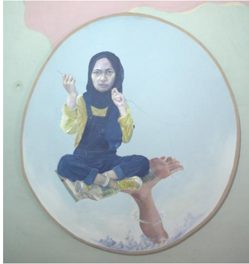
Karya: Gendi Malinyo Judul: Sedang Berlangsung Ukuran: diameter 100 cm Media: Acrylic on canvas Tahun: 2019

Karya ini membahas tentang karakter bergerak atau berhentinya melakukan suatu pekerjaan, hanya karena memikirkan seberapa besar nominal yang didapatnya dimana pemikiran dan kejujuran yang kita miliki dapat dibeli. Hal ini terjadi karena terlalu mengharapkan imbalan akibat hilangnya keikhlasan seseorang dalam melakukan aktivitas.