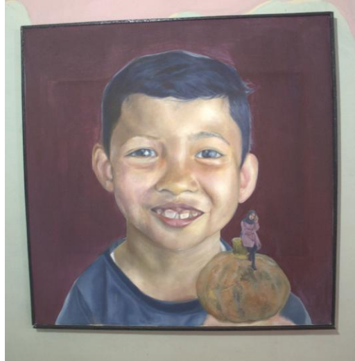
Karya: Gendi Malinyo Judul: Ambigu Ukuran: 100 X 100 cm Media: Acrylic on canvas Tahun: 2019

Pada karya ini membahas tentang persepsi atau pandangan masyarakat terhadap lingkungan sosial. Sebagaimana kita ketahui bahwa manusia memerlukan identitas atau jati diri.. Jati diri atau identitas dibutuhkan sebagai pengenalan dan penjelasan kepribadian seseorang. Dari interaksi yang dilakukan masyarakat sosial, dapat timbul berbagai persepsi terhadap bagaimana jati diri atau identitas dari seorang individu. Namun, masyarakat cenderung beranggapan sesuatu yang kecil itu lemah dan yang besar itu kuat. ” penulis berharap dapat memberikan motivasi kepada masarakat agar dapat menyeimbangkan pandangan atau persepti terhadap kelebihan dan kekurangan seseorang, karena manusia memiliki kelebihan dan kekurangannya masing-masing.