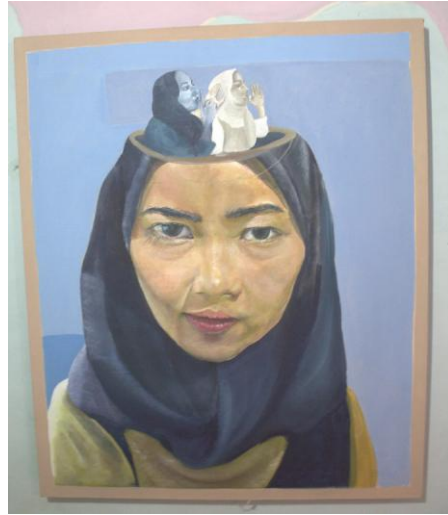
Karya: Gendi Malinyo Judul: Tentang mereka Ukura: 150 X 100 cm Media: Acrylic On Canvas Tahun: 2019

. Pada karya ini membahas tentang Manusia yang seringkali mengerjakan hal yang tidak penting dengan mengomentari atau membicarakan hal yang tidak berdampak positif bagi kehidupannya. Misalnya, mengurus kehidupan pribadi orang lain dan senang menjelekan orang tersebut, seperti menyebarkan keburukan seseorang kepada orang yang tidak dikenal, bahkan merasa seperti orang yang tidak memiliki dosa. Dalam karya ini penulis ingin menyadarkan kembali bahwa sikap berpandangan tidak baik atau buruk tentang seseorang seharusnya dihilangkan. Karena apa yang kita lihat belum tentu hal itu terjadi. Hal ini merupakan sikap yang tidak patut untuk dilestarikan..