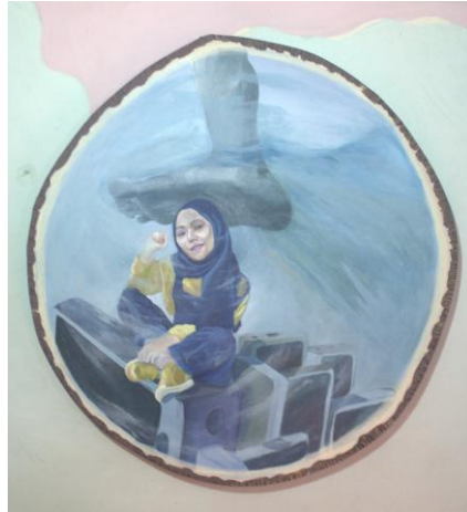
Karya: Gendi Malinyo Judul: Apatis Ukuran: diameter 100 cm Media: acrylic on canvas Tahun: 2019

Pada karya ini membahas tentang karakter sebagian dari masyarakat termasuk kalangan anak muda pada zaman sekarang yang membutuhkan jaringan internet dan telepon genggam untuk aktivitas komunikasi dan pembelajaran. Seperti, penggunaan media masa untuk mendapatkan informasi dan sebagainya. Hanya saja, penggunaan yang berlebihan dapat menimbulkan dampak negatif di antaranya, kurangnya kontrol sosial, tidak peka, kehilangan motivasi, timbulnya rasa individualisme, bahkan tumbuhnya perilaku yang tidak sesuai dengan norma.