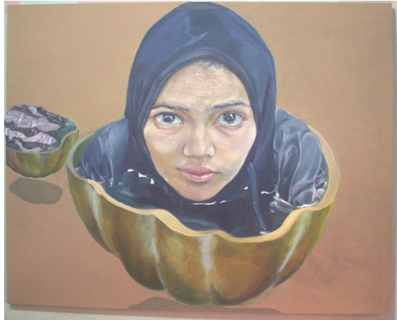
Karya: Gendi Malinyo Judul : Mengecap Ukuran: 110 X 130 cm Media: Acrylic On Canvas Tahun: 2019

Secara konseptual lukisan yang berjudul “mengecap” berangkat dari rasa empati penulis terhadap diri sendiri dan masyarakat sekitar yang terlalu cepat memberikan tanggapa terhadap seseorang atas lingkungan, pekerjaan, serta status tanpa memberikan pertimbangan. Tanggapan tersebut dapat dikatakan sebagai “lebeling”. Prilaku tersebut sering terjadi tanpa disadari. Seperti, satu orang berbuat yang tidak senonoh, orang akan mengecap seluruh keluarga itu kurang baik begitu pun dengan lingkungannya. Hal tersebut menjadikan seseorang memiliki sifat ketidakjujuran terhadap diri sendiri yang diakibatkan dari pemberian lebel pada dirinya.