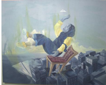
Karya: Gendi Malinyo Judul: Sindromstar Ukuran: 140 X 120 cm Media: acrylic on canvas Tahun: 2019

Pada karya ini membahas tentang seseorang yang memiliki jabatan, kekuasaan, kelebihan, serta mampu menikmati hal kecil yang dilakukannya, Sehingga timbulnya kesombongan. Kesombongan tersebut dapat menimbulkan rasa malas untuk membenah diri, merasa enggan melihat lingkungan sekitar, dan hilangnya rasa saling menghargai. Penyakit seperti ini membuat seseorang cepat merasa puas dan menimbulkan kesombongan yang menyebabkan dirinya berhenti untuk melakukan kaktifitas, seperti bekerja bahkan berkarya