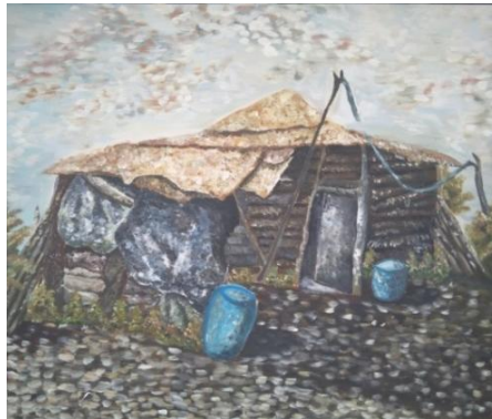
”Derita mereka”Oil on Canvas (100cm x 120cm) 2019

Karya ke tujuh ini yang berjudul “Derita mereka”, menampilkan sebuah objek rumah. Pada karya ini, penulis menyampaikan betapa pentingnya rumah dalam hidup ini, kebersihan dan kenyamanan rumah akan membuat orang yang tinggal betah dan sehat, tapi realita yang penulis temui masih banyak rumah yang di kategorikan ke dalam rumah tak layak huni seperti contoh lukisan rumah yang penulis lukis. Penderitaan yang di rasakan mereka sangat nampak dari rumah yang ditempatinya. Lukisan ini memberi gambaran bahwa ke pedulian masyarakat dan pemerintah sangat di butuhkan agar bisa meringankan penderitaan masyarakat yang tidak mampu, dan kehidupan mereka jauh lebih baik.