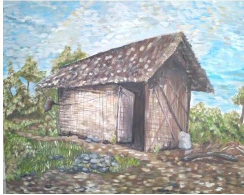
''Istana mereka ''Oil on Canvas (100cm x 120cm) 2019

Pada karya terakhir ini berjudul “ Istana mereka ” menampilkan sebuah pemandangan alam yang di tengah pemandangan ada sebuah rumah tua. Rumah dalam lukisan ini berdinding bambu dan atap rumah yang mulai rusak. Pada sudut rumah ada sebuah karung yang berwarna putih, dan disamping karung juga ada beberapa kayu yang sudah terpotong