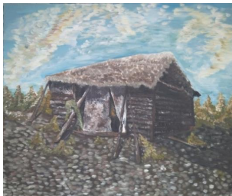
”Lentera kehidupan ?”Oil on Canvas (100cm x 120cm) 2019