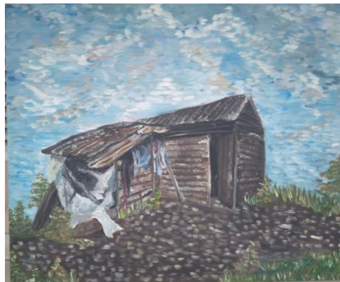
”Rumah berlantai tanah”Oil on Canvas (100cm x 120cm) 2019

Pada karya ini yang berjudul ”Rumah berlantai tanah” penulis menampilkan objek utama rumah, pada bagian depan rumah terdapat sebuah plastik yang menutupi dinding. Karya ini menyampaikan kesedihan dan kekecewaan masyarakat terlihat dari beberapa plastik yang menutupi dinding rumah yang bolong, hal ini merupakan ketidak berdayaan masyarakat dalam mencukupi kebutuhan hidup.