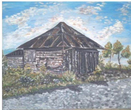
”Terbaikan” Oil on Canvas (100cm x 120cm) 2019

Karya yang diberi judul “ Terbaikan ” menampilkan sebuah rumah yang berada dipinggir jalan.. Pada bagian jalan tampak beberapa rumput yang berwarna hijau dan dua buah pohon yang tumbuh dengan subur.