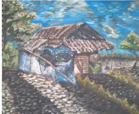
''Tertinggal''Oil on Canvas (100cm x 120cm) 2019

Pada karya ini penulis mencoba menampilkan keadaan rumah yang tidak layak huni tetapi masih di jadikan tempat tinggal oleh beberapa masyarakat. Dalam lukisan ini terlihat beberapa kain bagian samping dan depan rumah di gunakan untuk menutupi dinding rumah, menandakan kemiskinan masyarakat yang sangat memprihatinkan. Dalam karya ini harapan penulis adanya perbaikan untuk rumah-rumah di pelosok yang tertinggal menjadi rumah layak huni bersih, sehat dan aman untuk di tempati.