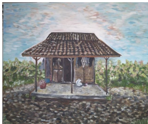
” Beranda”Oil on Canvas (100cm x 120cm) 2019

Karya yang berjudul “beranda” menampilkan objek rumah, Pada bagian depan rumah terdapat beberapa baju yang bergantung, karung yang berwarna putih, serta ember biru yang terletak bagian sudut rumah. Lukisan ini memberikan gambaran betapa besarnya harapan masyarakat yang kurang mampu untuk menikmati kehidupan yang lebih mencukupi. Kadaan rumah pada lukisan ini adalah keadaan yang sebenarnya terjadi pada masyarakat. Potret rumah ini menjelaskan bahwa kekurangan dan keterbatasan masyarakat menjadi penyebab utama kemiskinan.