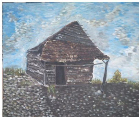
''Gubuk''Oil on Canvas (100cm x 120cm) 2019