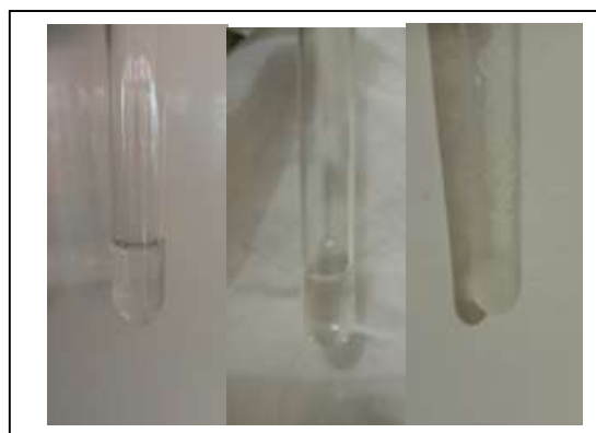
Gambar 1. (a) mikroemulsi w/o (b) sol (c) gel

Sol dipreparasi dari mikroemulsi water in oil yang merupakan campuran air, SDBS, dan pentanol. Tujuan preparasi sol mikroemulsi water in oil adalah untuk memperbesar kelarutan pigmen anorganik kuning dan hitam, sehingga dapat digunakan sebagai tinta ballpoint. Preparasi sol mikroemulsi water in oil terdiri dari dua tahap, yaitu tahap pembentukan mikroemulsi water in oil , dan pembentukan sol. Perbedaan mikroemulsi water in oil , sol dan gel pada sistem air, surfaktan, dan pentanol dapat dilihat dari Gambar 1 .