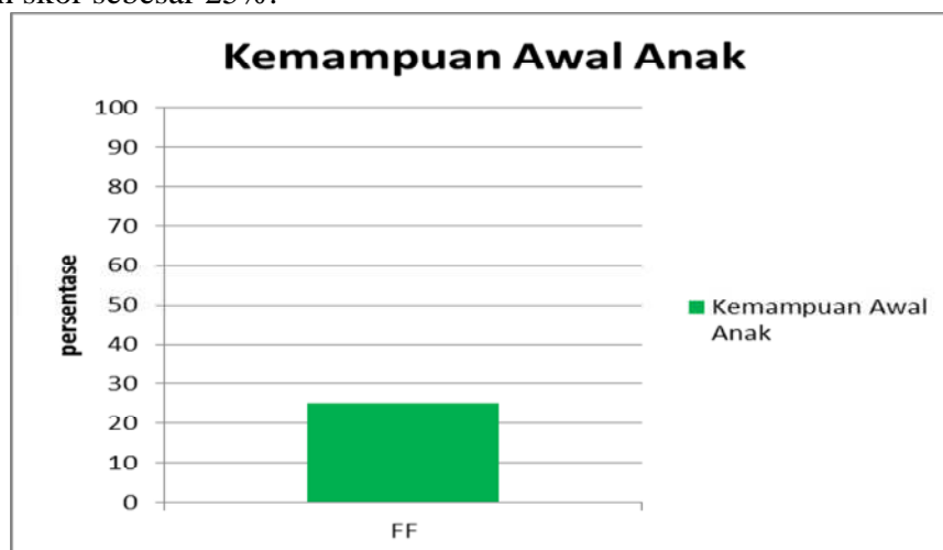
Grafik 1. Kemampuan Awal Siswa Menggunakan Program Jaws

Sementara aspek yang belum dikuasai anak ada 15 aspek diantaranya membuka lembar kerja baru, membuka file, menyimpan dokumen, membuka lembar kerja microsoft word , menebalkan huruf, memiringkan huruf, menggaris bawah huruf, membuat tulisan ditengah, mengganti ukuran huruf, mengcopy tulisan, mempastekan tulisan, keluar dari lembar kerja microsoft word , mempraktekkan cara menggunakan jaws dalam membaca dokumen perkata, mempraktekkan cara menggunakan jaws dalam membaca dokumen perparagraf dan yang terakhir memperbesar tulisan. Aspek yang sudah dikuasai anak Untuk hasil kemampuan awal siswa FF masih belum maksimal dan terbilang rendah siswa FF memperoleh skor sebesar 25%.