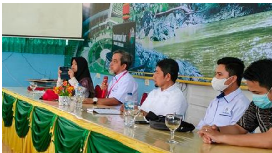
Gambar 2. Kegiatan Pembelajaran Teori

Pada tahap ini, kegiatan dilanjutkan dengan pemaparan materi teori dengan metode ceramah dan tanya jawab. Kemudian, dilanjutkan dengan pelaksanaan pembelajaran praktik melalui pengalaman langsung. Dimana peserta melakukan praktik secara langsung dengan dibimbing oleh instruktur dan dibantu oleh teknisi. Kegiatan ini dilaksanakan dalam waktu 2 x 8 jam pertemuan tatap muka. Dokumentasi kegiatan ini disajikan pada gambar 2 dan 3 berikut.