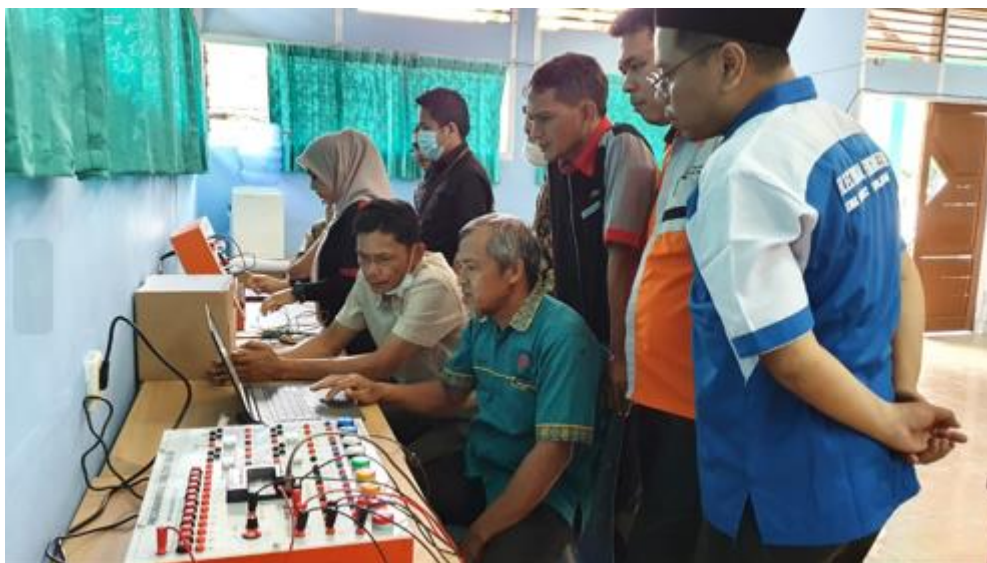
Gambar 3. Kegiatan Pembelajaran Praktik