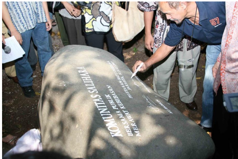
Gambar 2. Peletakan batu pertama Komunitas Salihara (Salihara Arts Center)

Salihara Arts Center merupakan lembaga seni-budaya dan pusat kesenian multidisiplin swasta pertama di Indonesia, yang resmi berdiri pada 8 Agustus 2008. Lembaga ini berakar dari Komunitas Utan Kayu (KUK), sebuah kantong budaya yang tumbuh di Jalan Utan Kayu 68H, Jakarta Timur. KUK didirikan pada 1995 oleh sekelompok sastrawan, intelektual, seniman, wartawan, dan para pengasuh Tempo, termasuk Goenawan Mohamad, setahun setelah pembredelan Majalah Tempo pada 1994. Dalam masa represi