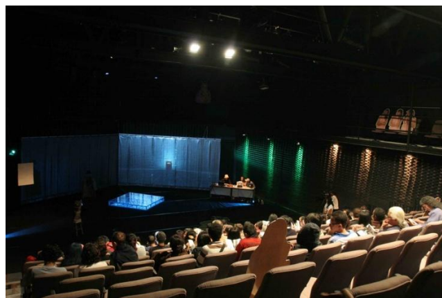
Gambar 1. Pertunjukan Teatrical di Salihara Arts Center

Pemanfaatan arsip seni pertunjukan tidak hanya memungkinkan karya lama dihidupkan kembali, tetapi juga membuka ruang interpretasi baru dan memperluas diskusi akademis mengenai konteks sosial serta budaya di balik setiap pertunjukan. Tidak sekadar berfungsi sebagai repositori pasif, arsip seni pertunjukan juga berperan sebagai alat aktif yang mendukung aktivitas penelitian, pendidikan, dan produksi seni yang berkelanjutan. Kebutuhan untuk memanfaatkan arsip seni pertunjukan menjadi semakin penting dalam dunia seni kontemporer, di mana penggunaan ulang atau re-performance sering kali menjadi bagian dari proses kreatif. Bagi seniman, arsip ini menjadi bahan untuk mempelajari ulang karya-karya mereka atau mengembangkan ide-ide baru dalam produksi seni. Bagi akademisi, arsip seni pertunjukan menjadi sumber kajian kritis yang memungkinkan untuk menganalisis evolusi seni pertunjukan dan mendalami dimensi budaya, sosial, dan historis yang ada di baliknya.