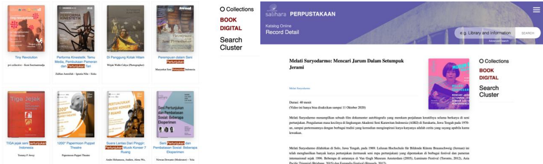
Gambar 4. Senayan Library Management System (SLiMS), Salihara Arts Center

Setelah tercipta, arsip disimpan dalam sebuah rak server dengan sistem pengamanan internal dan diperkaya dengan metadata yang mencakup judul, penampil, sinopsis, tanggal, tempat, dan tipe koleksi (Madani, 2025). Untuk mengelola koleksi tersebut, Salihara menggunakan platform open-source SLiMS (Senayan Library Management System) yang berfungsi ganda sebagai katalog pustaka dan sistem penyimpanan metadata dokumentasi audiovisual. Pemanfaatan SLiMS menggambarkan pendekatan yang pragmatis dan adaptif, meski sistem ini pada dasarnya dirancang untuk keperluan bibliografis, bukan pengelolaan arsip seni yang kompleks. Seperti diingatkan oleh Yang, metadata dalam arsip audiovisual seharusnya tidak hanya mendeskripsikan informasi dasar, tetapi juga merekam konteks naratif dan hubungan sosial yang melingkupi peristiwa seni (Yang, 2023).