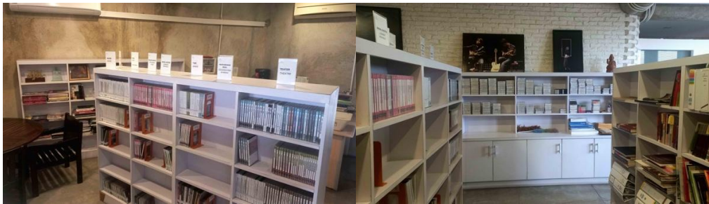
Gambar 3. Pusat Dokumentasi Salihara

Menempatkan dirinya di tengah hiruk-pikuk Jakarta, Salihara hadir dengan beragam program, mulai dari seni pertunjukan hingga kegiatan pendidikan, dalam sebuah lingkungan yang dirancang untuk sekaligus kreatif dan reflektif. Seperti tercantum dalam misinya, Salihara terbuka bagi siapa pun yang ingin mengembangkan keterampilan dan kreativitas melalui eksplorasi seni dan gagasan, dengan komitmen pada keberagaman serta kebebasan berekspresi. Orientasi ini menjadikan Salihara bukan hanya panggung bagi “seni mutakhir” dari Indonesia dan mancanegara, melainkan juga ruang yang menumbuhkan kreativitas serta eksplorasi intelektual.