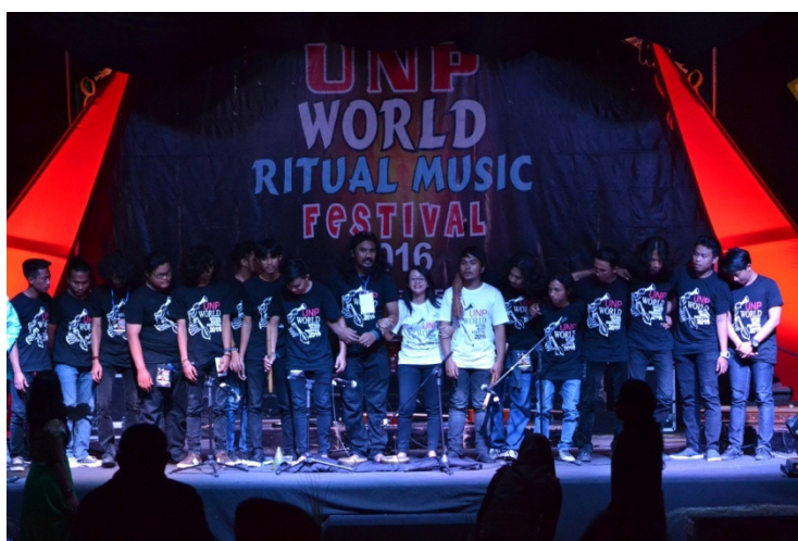
Gambar 2. Pemain Musik “Subhaa” Anggota Subha

Pada penampilan komposisi musik Subhaa , penataan cahaya mengikuti alur musik. Umumnya tata cahaya menggunakan cahaya netral (putih), karena latar belakang dari panggung pertunjukan berwarna gelap. Namun beberapa kali ada berwarna redup dan berwarna kontras guna untuk melahirkan suasana yang dramatis serta mendukung suasana yang diinginkan oleh composer.