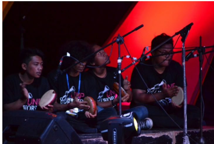
Gambar 4. Pemain Rapa'i (Dokumentasi Harisnal Hadi, tanggal 3 September 2016)