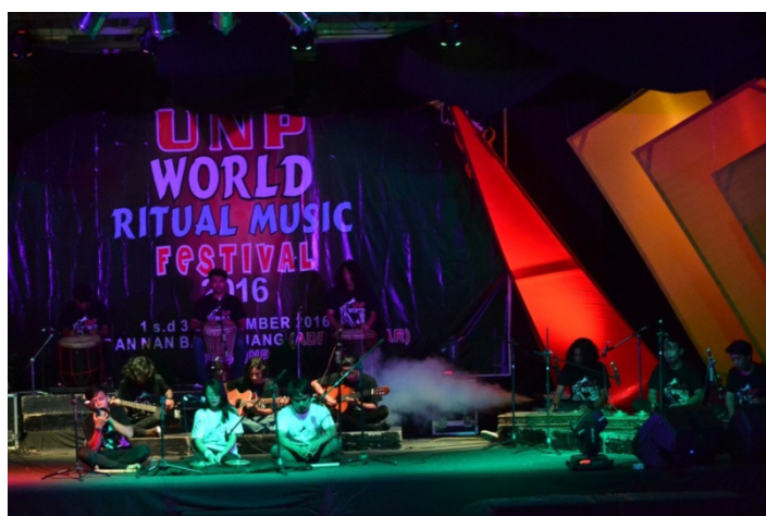
Gambar 6. Pemain Karya Musik dalam pertunjukan “Subhaa” (Dokumentasi Harisnal Hadi, tanggal 3 September 2016)

Diawali permainan canang dengan birama 2/4 , diikuti permainan talempong dengan birama 3/4 , permainan indang dengan hitungan genap ganjil, dimana pukul dengan hitungan genap 2,4,6,8 dan istirahat dengan hitungan ganjil 3,5,7,1, setelah itu djembe masuk dengan birama 5/4 , diikuti permainan bass dengan hitungan 7,5,3,1 dan gandang tambua dengan hitungan 2,4,6,8. Diikuti permainan gitar dengan hitungan 1 istirahat 4, 2 istirahat 4, 3 istirahat 4, 4 istirahat 8. Setelah bermain bersama, setiap pemain mengakhiri bagian mereka masing-masing, dimulai dari gitar, djembe, rapa'l, tambua dan bass, talempong dan canang, pupuk batang padi bermain sampai lampu mati sebagai ending garapan karya.