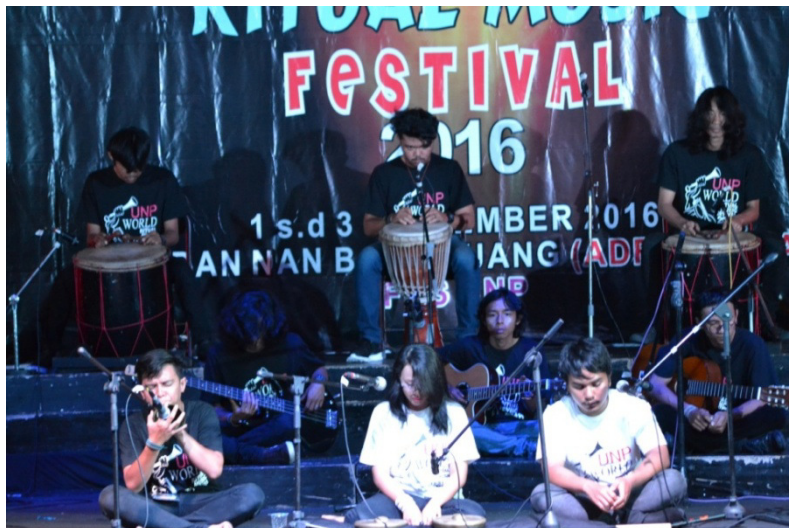
Gambar 5. Pemain Karya Musik “Subhaa”

empat birama. Diakhiri dengan dendang sunting patah batikam sebagai jembatan untuk bagian ketiga.