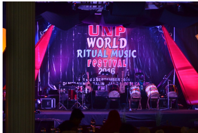
Gambar 1. Tempat Pertunjukan UNP World Ritual Festival 2016 (Dokumen Harisnal Hadi, tanggal 1 September 2016)

Dari berbagai sumber tersebut, dapat disimpulkan bahwa gedung pertunjukan, atau dalam bahasa Inggris lebih sering disebut dengan theatre, merupakan sebuah tempat di mana para seniman mempertunjukan karya seninya yang memiliki unsur audio-visual, berupa gerakan yang bisa dilihat atau ditonton dan suara yang bisa didengar, baik musik maupun vocal.