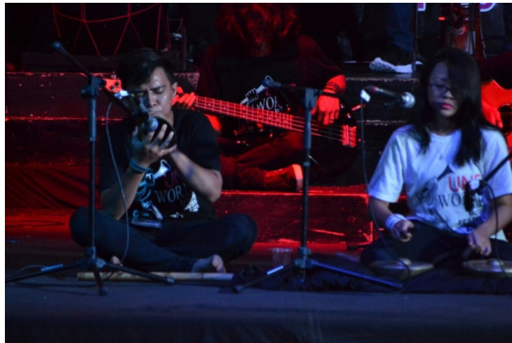
Gambar 3. Pemain Pupuik Batang Padi dan Pendandang (Dokumentasi Harisnal Hadi, tanggal 3 September 2016)

pola interlocking gitar dan gitar bass, pola unison seluruh media, masuk pola rapa'i bermain interlocking dengan pertukaran warna bunyi, gitar dan bass masuk disaat pengulangan siklus kedua, unison empat kali, disambut permainan talempong pacik, instrument lain bermain secara bergantian, hingga seluruh instrument bermain, pada akhir bagian saluruh instrument kecuali talempong dan canang berhenti.