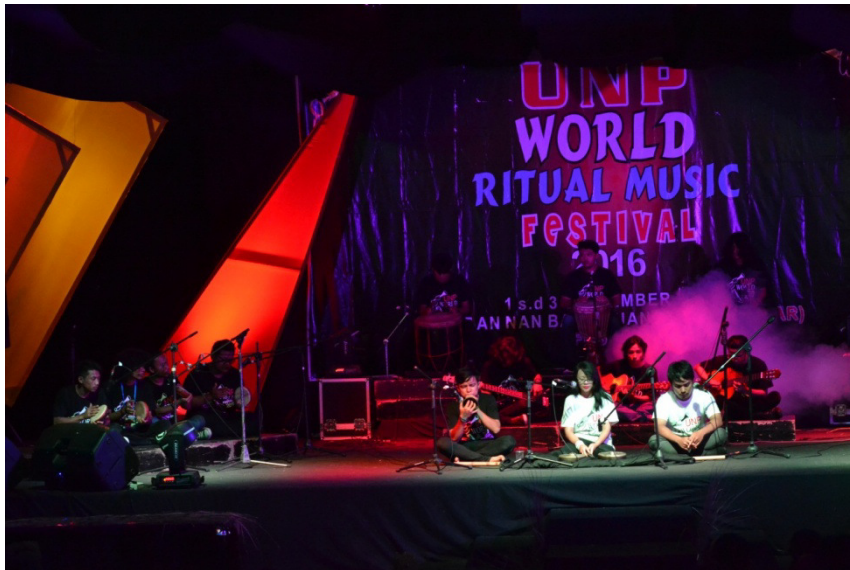
Gambar 7. Pemain Karya Musik dalam pertunjukan “Subhaa” (Dokumentasi Harisnal Hadi, tanggal 3 September 2016)