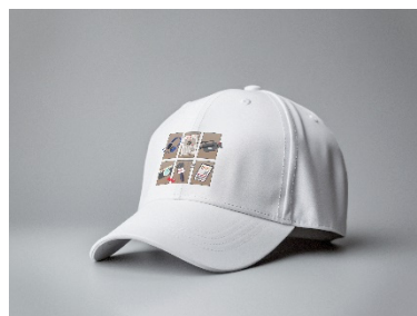
Gambar 6. Final Topi