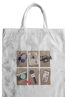
Gambar 7. Tote bag