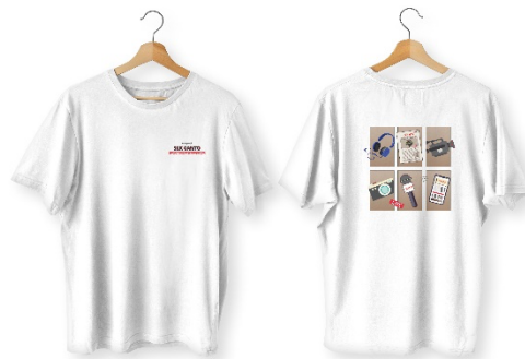
Gambar 5. Final T-shirt