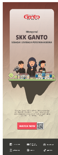
Gambar 4. Final Banner