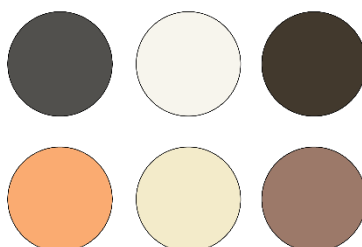
Gambar 1. Warna desain

Warna yang digunakan pada perancangan ini menggunakan warna yang dominan kecoklatan seperti halnya surat kabar yang mempresentasikan artistic.