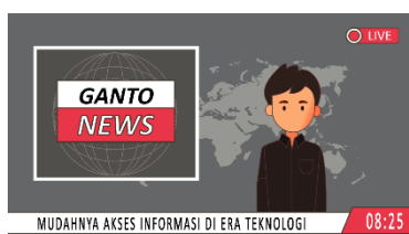
Gambar 2. Video Motion Graphic