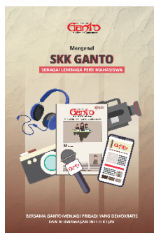
Gambar 3. Final Poster