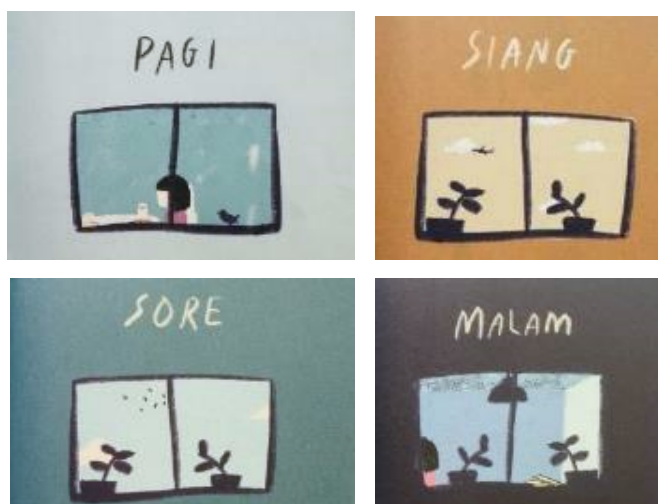
Gambar 3 Ilustrasi Sampul Tiap Bab Buku NKCTHI

Pada bagian sampul tiap bab terdapat perbedaan komposisi bentuk dalam ilustrasi bagian sampul menandakan adanya perbedaan latar dan kejadian. Terdapat perbedaan pengamatan mata manusia pada ilustrasi sampul bab buku NKCTHI. terlihat dengan adanya figure bentuk awan, pesawat dan burung dilangit pada bidang jendela mempresepsikan bahwa pengamat berada didalam ruangan memperhatikan kejadian diluar. Sedangkan figure manusia, lampu dan dinding ruangan pada bidang jendela mempresepsikan pengamat berada diluar ruangan. Pada pengamatan lainnya ilustrasi tersebut juga bisa dipresepsikan kedalam sebuah fugura atau lukisan di dinding.