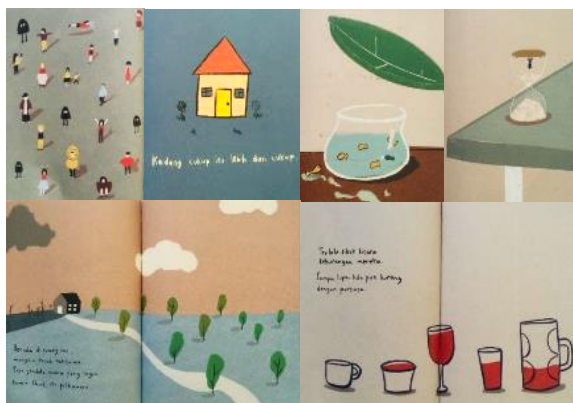
Gambar 4 Bentuk Ilustrasi isi buku NKCTHI

tersebut mengesankan suasana yang damai, santai, tenang namun tetap kuat menekankan suasana cerita yang ringan dan sederhana. Tekstur garis yang seperti goresan krayon atau pastel pada ilustrasi tersebut tercipta karena media garis menggunakan media keras.