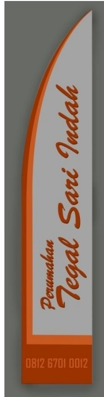
Gambar 16 Umbul-umbul