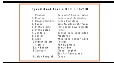
Gambar 10 Spesifikasi teknis rumah