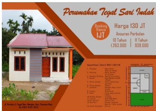
Gambar 11 Media pendukung Leaflet