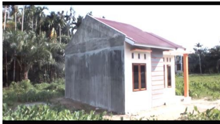
Gambar 3 Tampak samping kiri depan