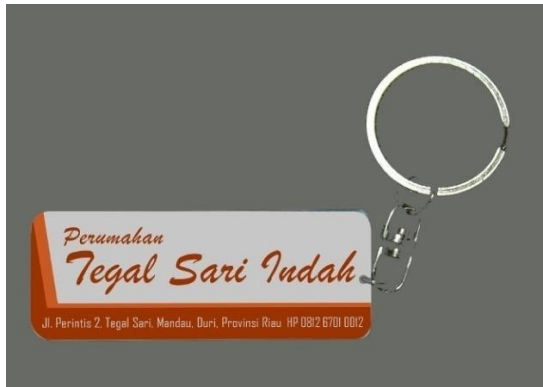
Gambar 13 Media pendukung Gantungan kunci