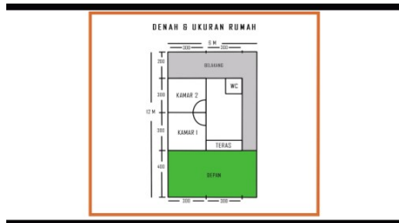
Gambar 9 Denah dan ukuran rumah