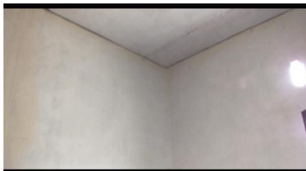
Gambar 7 Gambar bagian kamar