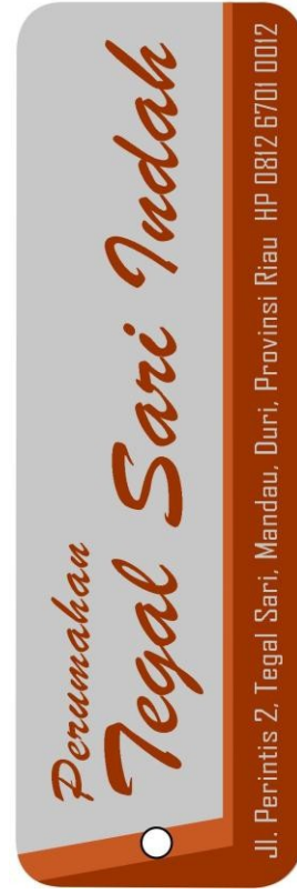
Gambar 17 Gantungan kunci