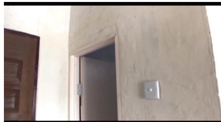
Gambar 8 Bagian depan kamar mandi