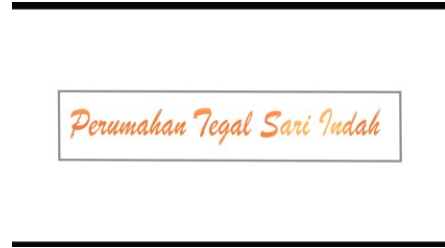
Gambar 2 Petunjuk Judul Video