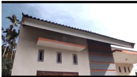
Gambar 5 Gambar detail depan rumah