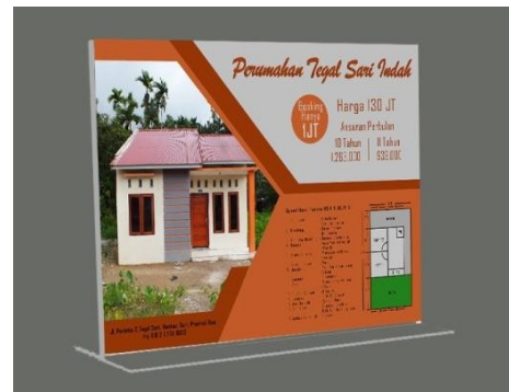
Gambar 12 Media Akrilik stand