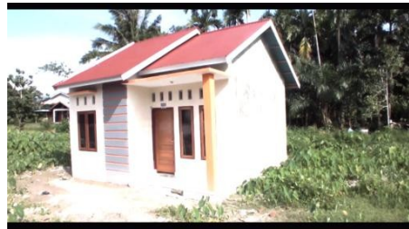
Gambar 4 Tampak samping kanan depan