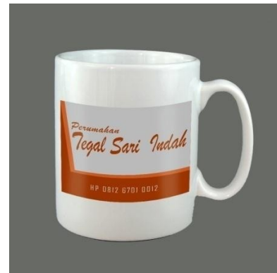
Gambar 14 Media Pendukung Mug