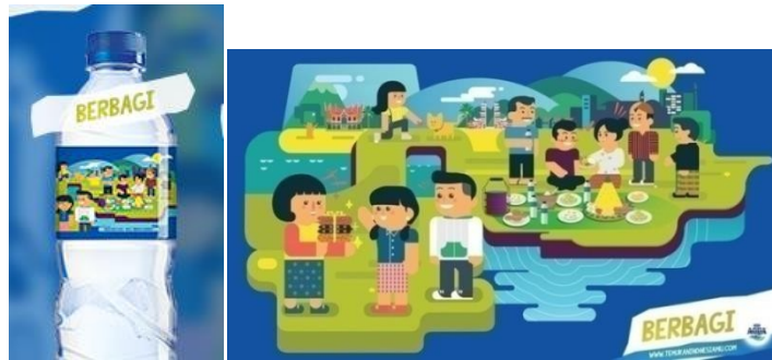
Gambar 3. Label Kemasan Aqua Temukan Indonesiamu tema Berbagi

Berdasarkan pengamatan peneliti melalui berbagai sumber yang ada gaya ilustrasi pada tema berbagi ini menggunakan gaya ilustrasi kartun, karna semua itu bisa terlihat jelas dari bentuk objek manusia hewan lingkungan dan latar tempat yang digunakan berupa bentuk ilustrasi kartun dua dimensi.