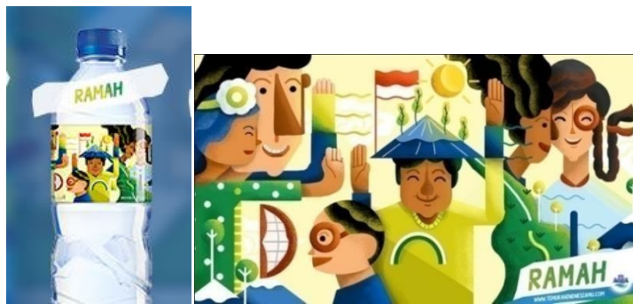
Gambar 4. Label Kemasan Aqua Temukan Indonesiamu tema Ramah

Berdasarkan pengamatan peneliti melalui berbagai data yang ada dapat dikatakan bahwa gaya ilustrasi pada tema ramah menggunakan ilustrasi bergaya Pop Art, karna terlihat pada objek satu sama lainnya yang saling menindih dan berdempet, pada bagian objek sebelah kanan dimana bajunya telah ditutupi oleh objek jalan dan sawah, serta diberikan juga effect warna dengan gradasi, hingga ilustrasinya menjadi mudah diingat dan tidak membuat konsumen bosan ketika melihat.