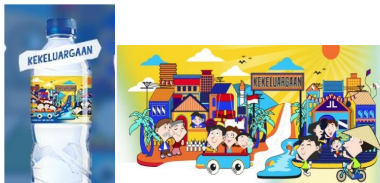
Gambar 5. Label Kemasan Aqua Temukan Indonesiamu tema Kekeluargaan

Gaya ilustrasi yang digunakan oleh ilustrator pada desain kemasan aqua label khusus Temukan Indonesiamu tema Kekeluargaan ini menggunakan ilustrasi gaya kartun dua dimensi dan gaya karikatur, karna terlihat dari objek manusia dengan gambaran kepala yang lebih