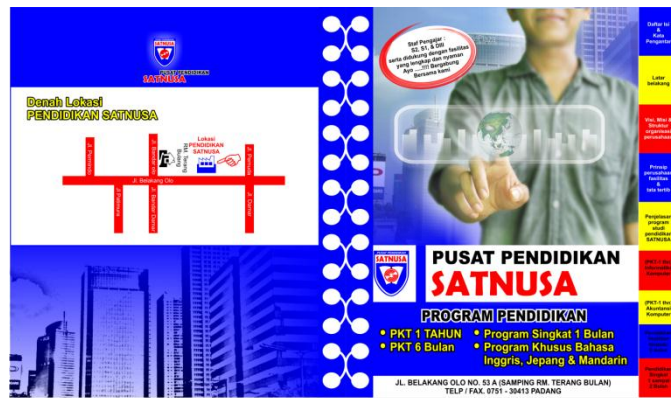
Alternatif 1 ukuran 40 cm x 21,5 cm