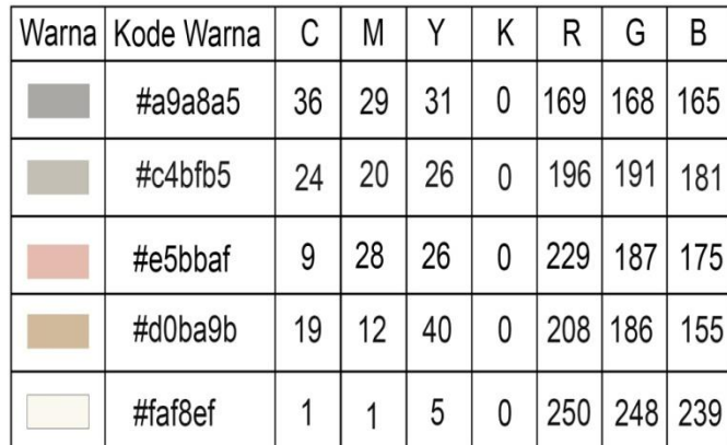
Tabel 2. Warna CMYK yang digunakan dalam perancangan katalog JJ Detail Boutique