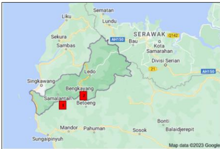
Gambar 1: Lokasi data titik bor

Teknik analisis data yang dilakukan pada penelitian ini meliputi data lapangan dan data laboratorium untuk mendapatkan: