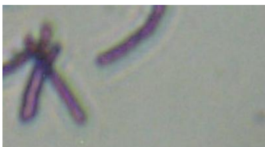
Gambar 2. Morfologi sel Bacillus sp. (Gram positif dan Batang)