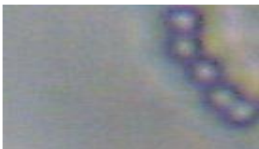
Gambar 1. Morfologi sel Enterococcus sp. (Gram positif dan Streptococcus)