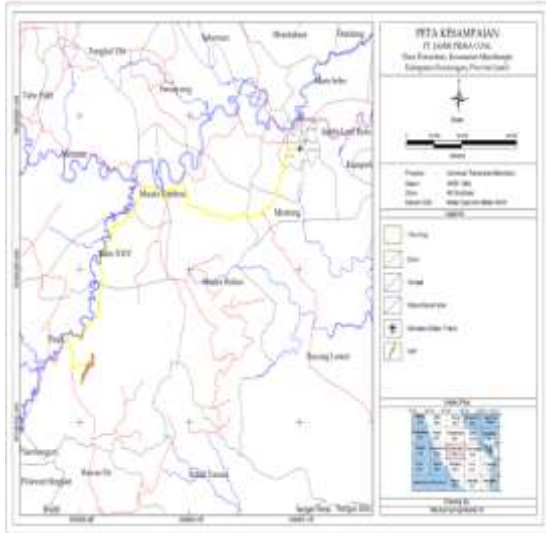
Gambar 2. Peta Kesampaian Daerah Penelitian