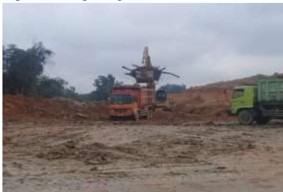
Gambar 1. Penggalian dan pemuatan overburden

Dalam proses kegiatan pengupasan lapisan tanah penutup, PT. JPC menggunakan rangkaian kerja alat gali - muat ( excavator ) dan alat angkut ( dump truck ) untuk memindahkan material dari loading point ke disposal . Pengupasan lapisan material penutup merupakan salah satu proses kegiatan yang penting dalam kegiatan penambangan. Proses tersebut dapat dilihat pada gambar 1