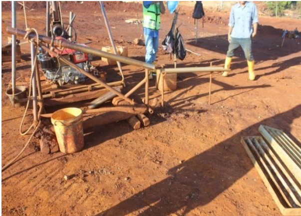
Gambar 6. Body Protector Core

Body protector core berfungsi sebagai alat untuk melakukan penumbukan untuk mengeluarkan hasil dari pemboran.