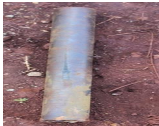
Gambar 5. Tube atau Core Drill

Tupe Atau Core Drill berfungsi untuk mengangkut core dengan cara langsung menghubungkannya ke mata bor. Tube yang ada pada kegiatan ini terdiri atas dua yaitu tube dengan panjang 50 cm dan 100 cm.