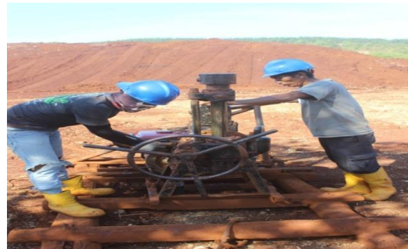
Gambar 3. Mesin Bor Koken YS-01.

Dalam kegiatan inpit drill PT.ANTAM Tbk. Unit Bisnis Penambangan Nikel menggunakan mesing bor Koken dengan tipe YS-01