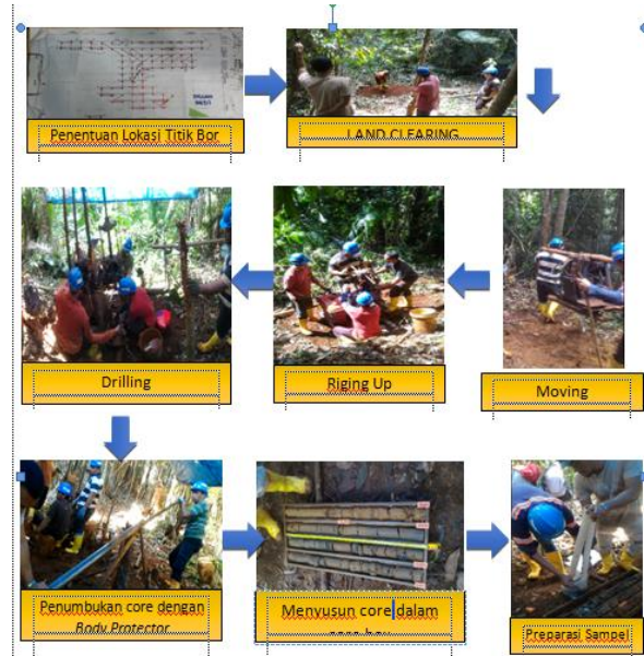
Gambar 16. Alur Kegiatan Pemboran

Area existing section A-A' lereng tidak mengikuti kajian geoteknik dan geometri lereng rekomendasi kajian geoteknik sebelumnya yaitu dengan tinggi individual slope 15 meter, lebar jenjang 7,5 meter dan individual face angel 70 0 , sehingga pada tahun 2018 lereng pada area existing front II mengalami kelongsoran, dengan tinggi lereng 18 meter dan sudut 85 0 . Longsoran terjadi pada batuan yang mengalami pelapukan dimana longsoran diidentifikasi berupa longsoran busur.