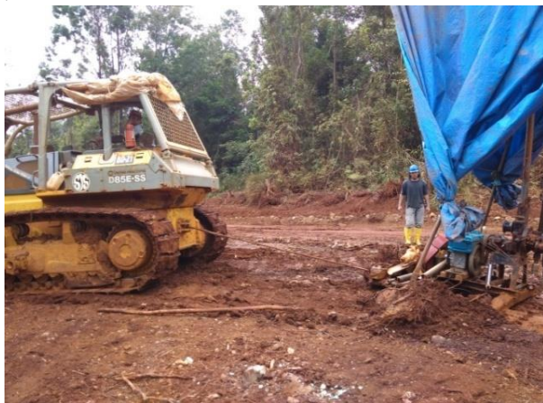
Gambar 11. Moving Alat Bor menggunakan Buldozer

Pada saat kegiatan pemboran telah selesai dilakukan maka akan dipindahkan ke titik bor selanjutnya, dalam pemindahan alat bor biasanya dibantu oleh buldozer.