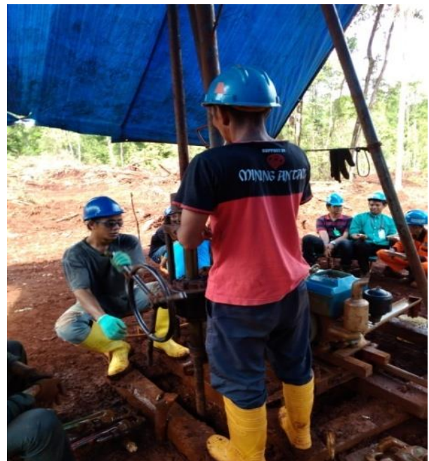
Gambar 13. Proses Pemboran

Proses pemboran yang dimaksud adalah saat mesin penggerak telah terpasang tube nya, yang dilanjutkan terhadap proses running hingga core yang di dapatkan dalam kedalaman tertentu telah tercapai.