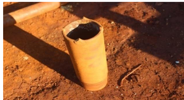
Gambar 4. Mata Bor 6 Skala Mosh

Mata bor yang digunakan yaitu bertipe widya dengan kekerasan yang dimiliki 6 Skala Mosh . Sedangkan gabungan dari mata bor dengan batang dinamakan tungsten bit . Mata bor yang dipakai sebanyak 6 buah.