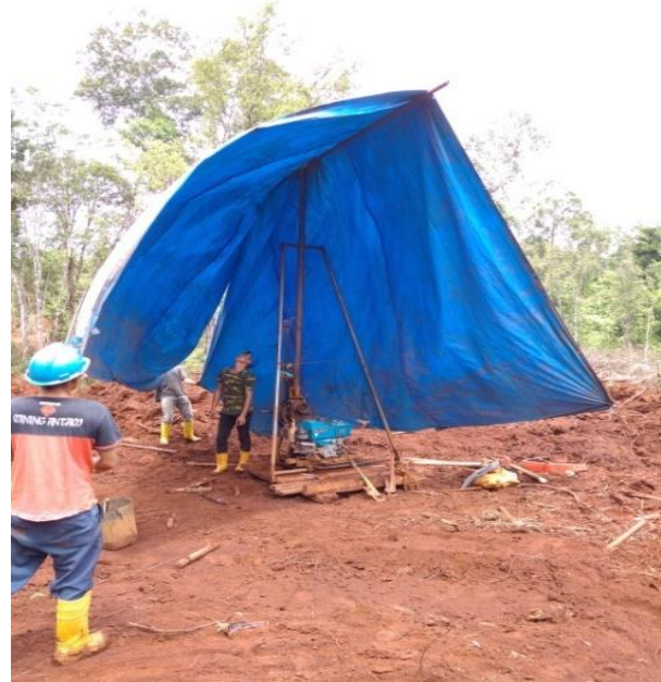
Gambar 12. Pemasangan Alat Bor

Selanjutnya pemasangan tube dengan panjang 50cm karena jika dengan menggunakan tube panjang 100cm jarak spasi antara spindel dengan tanah tidak memungkinkan untuk pemasangan tube .