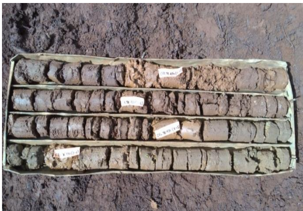
Gambar 15. Core didalam Core Box

Setelah hasil coring ditumbuk, maka core dimasukkan ke dalam core box dengan cara didorong perlahan sesuai dengan titik lokasi bor nya dan kedalamannya.