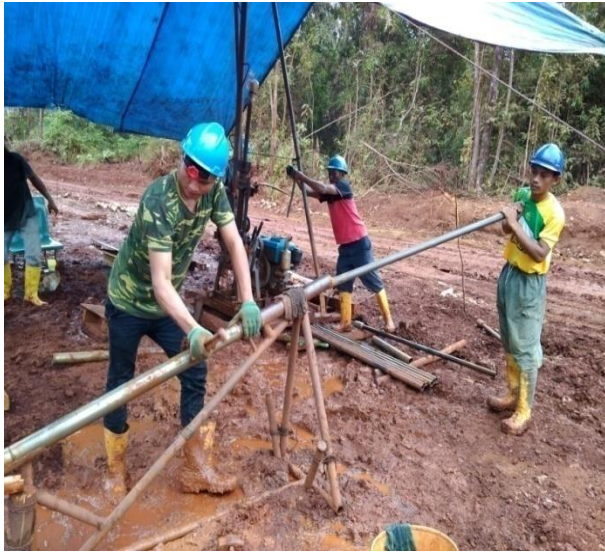
Gambar 14. Penumbukan Core

Tube yang telah dilepaskan lalu dibawa ke body protector core untuk dilanjutkan ke tahap penumbukan, dimana proses ini dilakukan oleh dua orang. Satu orang sebagai penumbuk dan satu lagi untuk menampung core hasil tumbukan.