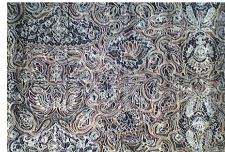
Gambar. Motif Wahyu Tumurun yang belum di stilasi dan sudah distilasi