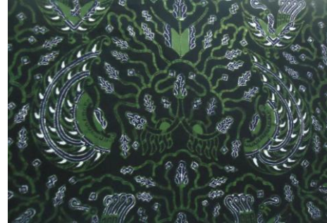
Gambar. Motif Sido Asih belum di stilasi dan sudah distilasi