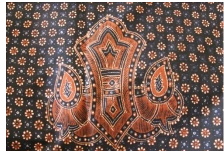
Gambar. Motif Truntum yang belum di stilasi dan sudah di stilasi