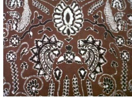
Gambar. Motif Srikuncoro yang belum di stilasi dan sudah distilasi