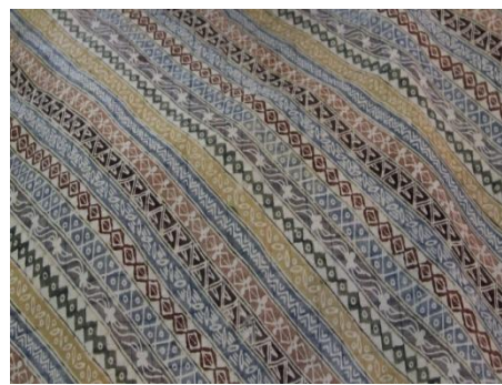
Gambar. Motif Udang Liris yang belum di stilasi dan sudah di stilasi