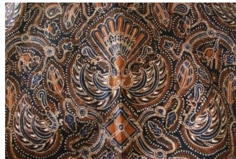
Gambar. Motif Sido Mukti yang belum distilasi dan sudah distilasi