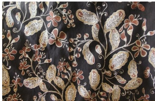
Gambar. Motif Sirgunggu Wiguno

Motif batik di Sri Kuncoro memiliki ragam hias naturalis pada motif utama dan motif pelengkap yaitu hewan dan tumbuhan, geometris terdapat pada pengisian bidang motif batik, dan dekoratif terdapat pada motif utama berupa mahkota. Menurut Ernawati (2008:387): “bentuk ada tiga macam yaitu bentuk naturalis, bentuk geometris, dan bentuk dekoratif”.